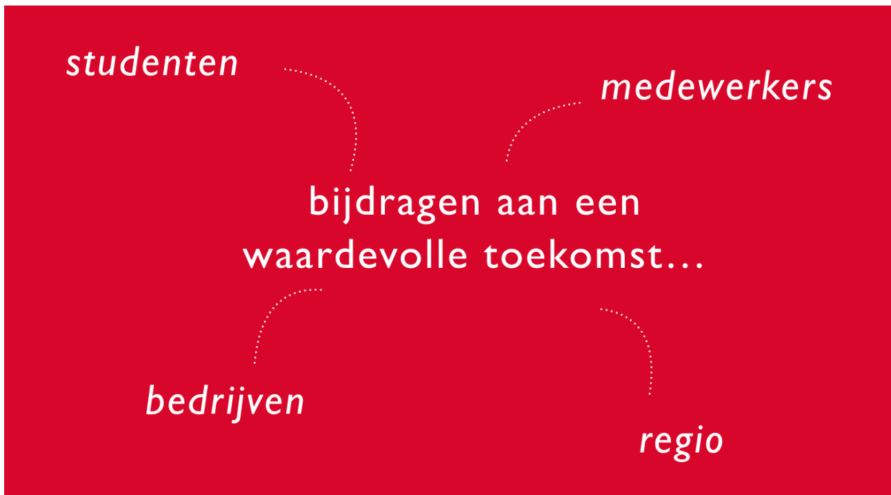
Figuur 1 Onze bedoeling: bijdragen aan een waardevolle toekomst