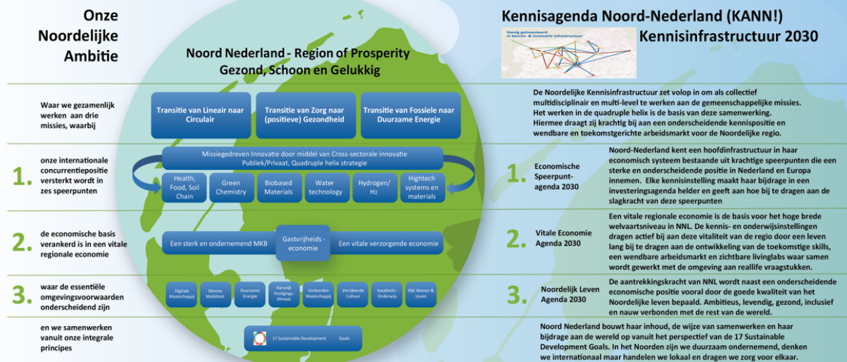
Figuur 2 Kennisagenda Noord-Nederland (KANN!)

De KANN zal leiden tot een Human Capital agenda voor onze regio. Het ontbreekt regionaal mkb vaak aan schaal om op dit gebied te blijven investeren in toekomstbestendig personeelsbestand. Dit terwijl het hart van onze Drentse economie wordt gevormd door de huidige werknemers. Leven Lang Ontwikkelen (LLO) wordt daarmee vanzelfsprekender in ons portfolio. Naast bedrijven en instellingen zijn ook andere onderwijsaanbieders steeds meer partner in de regio. Drenthe College, Noorderpoort en Alfa-college werken steeds intensiever samen. Met het belang van de regio voorop en veel minder vanuit instellingsbelang. De samenwerking met de NHLStenden wordt intensief op de Campus in Emmen met doorstroom-routes en Associate Degrees. En het groene profiel van Terra biedt prachtige samenwerkingskansen met Drenthe College, waar elke regio waar we samen onderwijs aanbieden van profiteert. Ook met het vo worden de banden verder aangehaald. Met de Universiteit van het Noorden aan boord kan de campus in Emmen zich verder ontwikkelen tot kerncampus, die ook aantrekkelijk is voor het Duitse grensgebied.