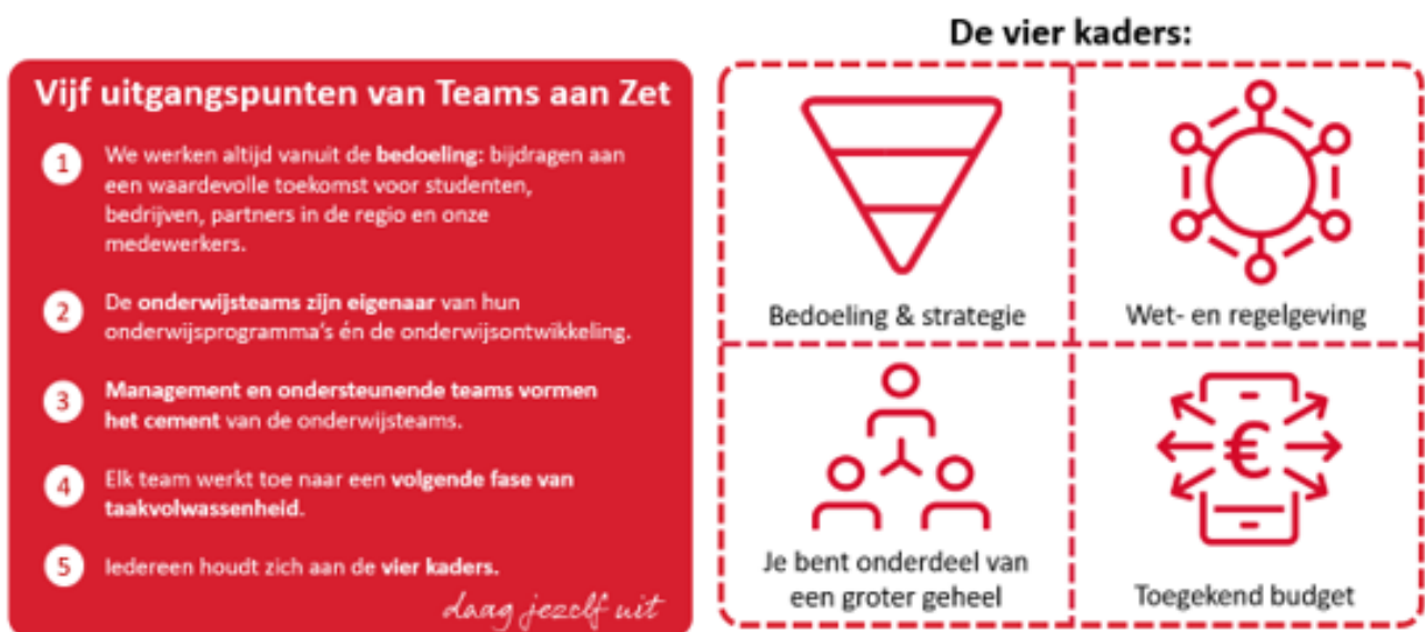
Figuur 4 Uitgangspunten en kaders Teams aan Zet

Met Teams Aan Zet zetten we de student centraal. Door de onderwijsteams de regie te geven op het onderwijs, wordt het onderwijs ontwikkeld door teams die het dichtste bij de student staan. Onderwijsteams kennen de student, kennen de opleiding, maar ook de regio en het werkveld het beste. Zij hebben oog voor wat een ieder nodig heeft om klaar te zijn voor de toekomst.