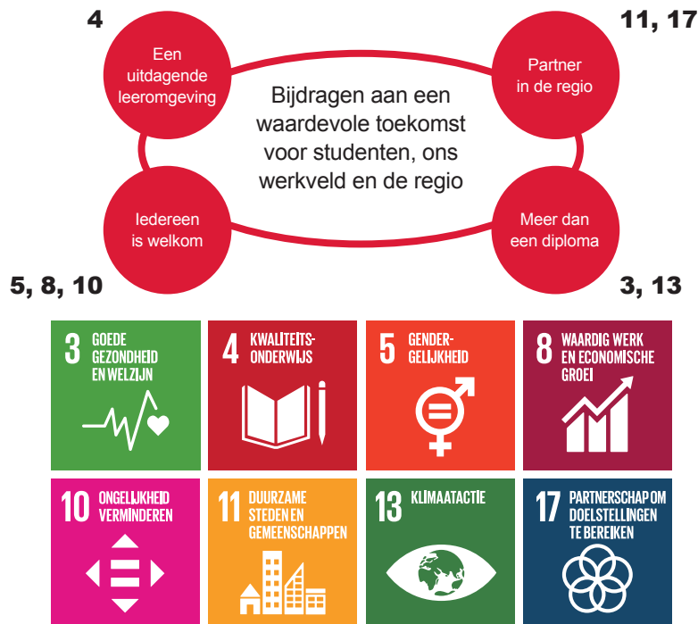
Figuur 3 Sustainable Development Goals voor Drenthe College

In ons onderwijs komt expliciet meer aandacht voor thema's als ondernemerschap en duurzaamheid en dus de Sustainable Development Goals. Drenthe College legt in het werken aan de SDG's de nadruk op die doelen die in het logische verlengde liggen van onze strategie en redeneert daarin zowel van binnen naar buiten als andersom. Welke impact hebben we met ons onderwijs op de gekozen doelen en welke impact hebben de doelen op ons. We verantwoorden ons aan de hand ESG's (Environmental, Social en Governance) over de impact die we hebben naar onze omgeving en onze partners.