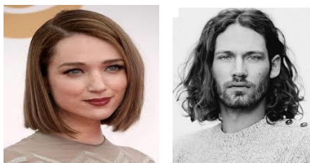
1 lengte lijn