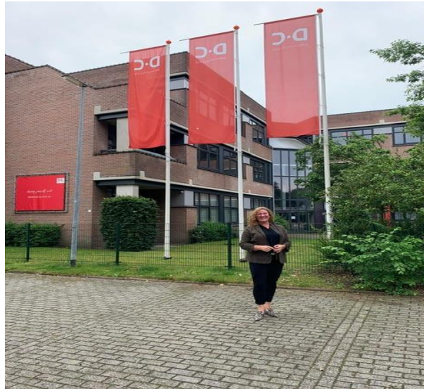
Baukje Pander Handel & Commercie N3 / N4 Zakelijke Dienstverlening N3 / N4